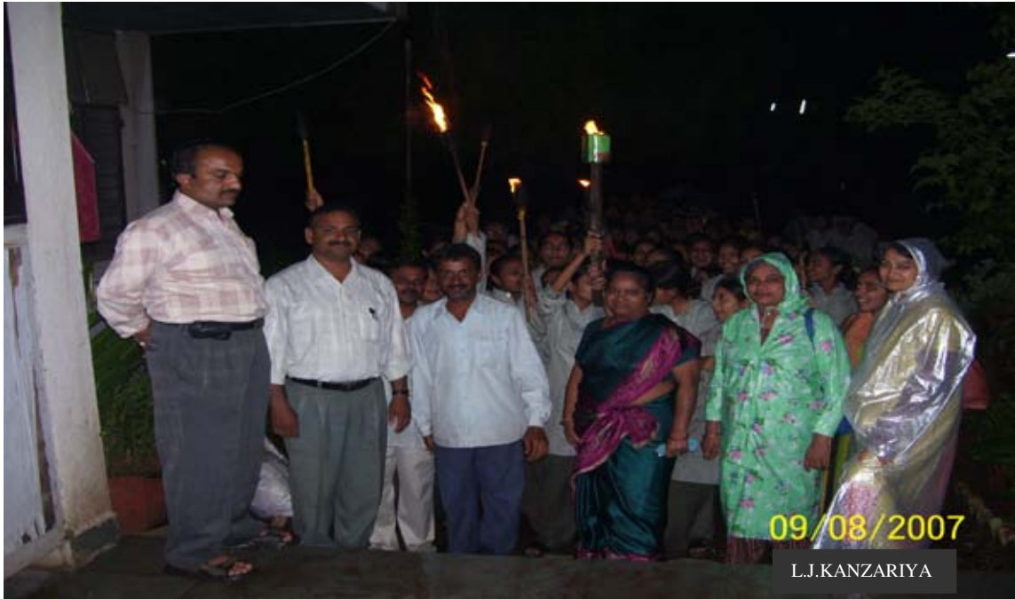
મશાલ સરઘસ અને મહાઆરતીમાં જોડાયેલ ડાયેટ સ્ટાફ